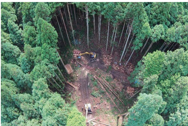
高性能林業機械による木材生産