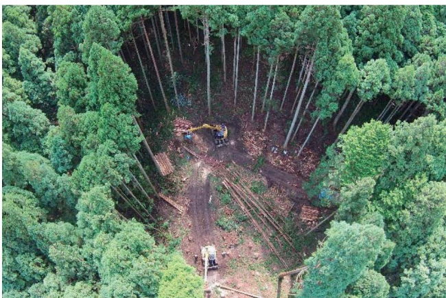
高性能林業機械による木材生産