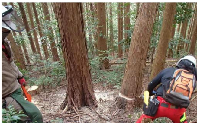
洲本市有林にて保育間伐の作業状況