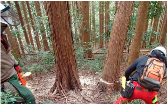
洲本市有林にて保育間伐の作業状況