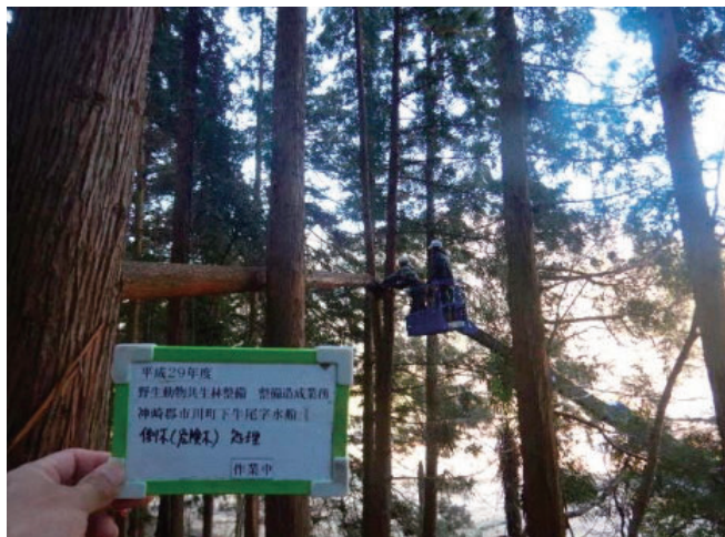
倒木(危険木)処理作業