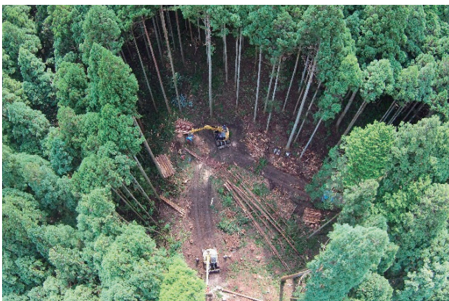
高性能林業機械による木材生産