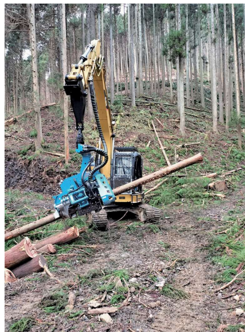
ハーベスタによる玉切り状況