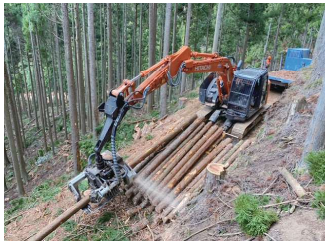
プロセッサによる造材状況