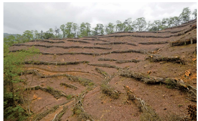
水源林造成事業による地拵完成現場