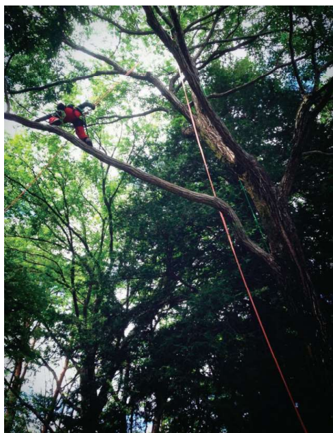
樹上へロープアクセス

自社で森林経営計画の認定を受け、計画から現場作業まで一貫して行うことにより、当社の企業理念である「森林・樹木の防災整備」を行うことができます。また、安全装備品等の支給により、社員の安全対策を何より優先しています。そして、危険木特殊伐採(樹上作業)にも力を入れ、海外の技術や道具の情報を取り入れています。