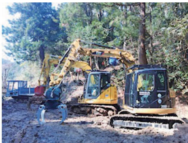
林業機械を連携させた素材生産