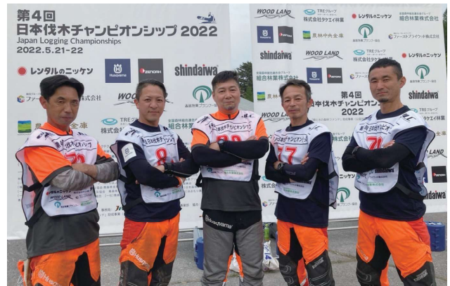
JLC(日本伐木チャンピオンシップ)に参加