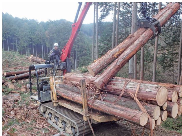
フォワーダによる木材運搬