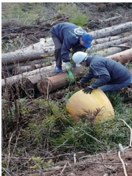
ウインチによる搬出状況