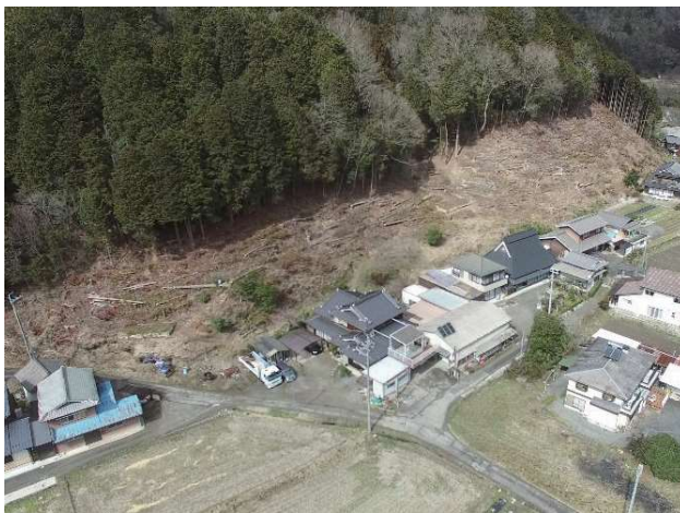
人家裏山の危険木伐倒後の状況