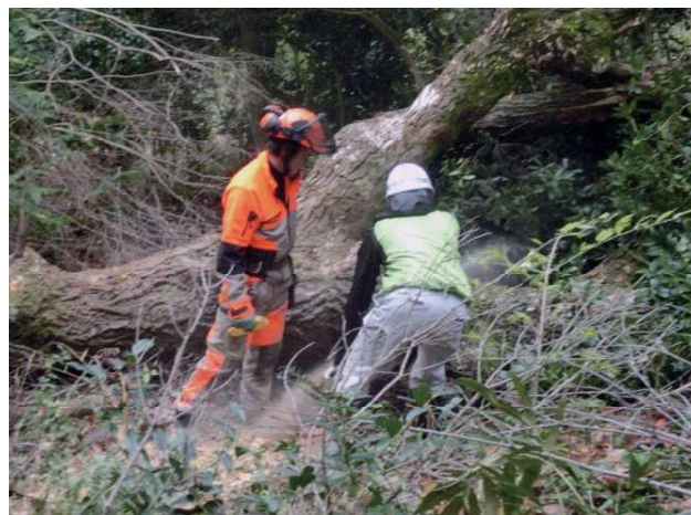
危険木の伐採指導状況