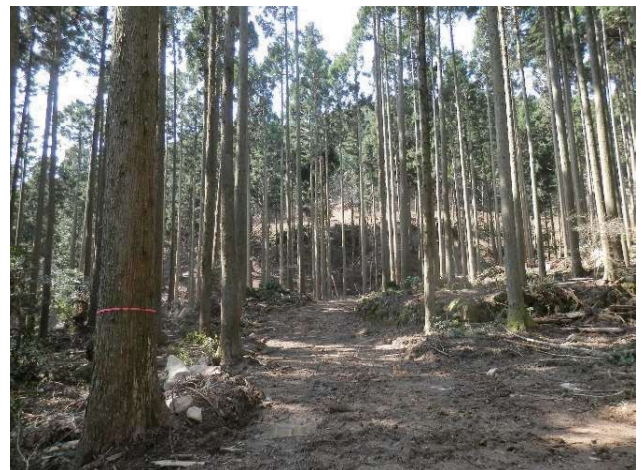
搬出間伐後の林内の状況