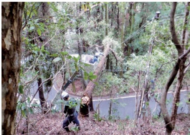
配電線への倒木処理作業